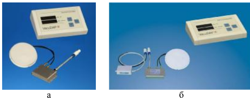
Рисунок 2 - Внешний вид дозиметров модификации VacuDAP-C: а – VacuDAP-C; б – VacuDAP-C Bluetooth